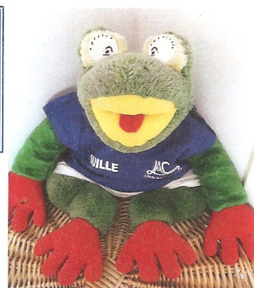
Le « relooking » de Ouille